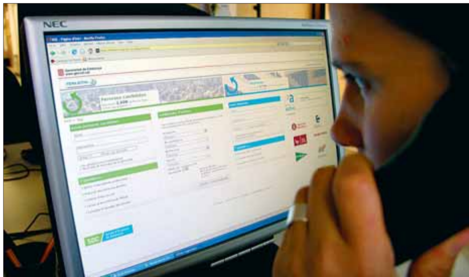
La Generalitat posa en marxa diferents projectes relacionats amb el món digital ■ JORDI GARCIA

Altres projectes són els museus en línia, amb 230.000 objectes, dels quals 107.000 tenen imatges associades i en què han participat 42 museus de Catalunya, “xifra que volem aug-